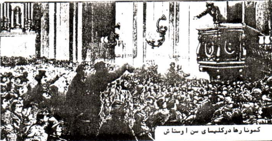
کمونارها در کلیسای سن اوستاش

آخرین نفرشان بر زمین می افتاد نوبت به کشتار کودکان و زنان و مردان سالخورده و بی دفاع میرسید تا از دم تیغ قتل عام قصابان کمون بگذرند. آخرین مقاومت ها در محلات شرقی شهر یعنی بخش کارگرنشین پاریس نیز درهم شکسته شد. آنها کارگران را دسته دسته در کناره های رود راین "پیرلاشیز" تیرباران کردند. دیواری که دیگر از آن بیعد دیوار کمون رها نمانده شد. به این ترتیب کارگران بی آنکه به زانو درآیند شکست خوردند. اما حتی پس از شکست کمون دستگیری های وسیع، محاکمه ها و اعدام ها و تبعیدهای دسته جمعی مبارزین پاریس تا مدت ها ادامه داشت. بورژوازی چنان به وحشت افتاده بود که گوئی نمیخواست حتی آنها را که در دوره ای کوتاه شاهد حکومت کارگران بوده اند زنده بگذارد.